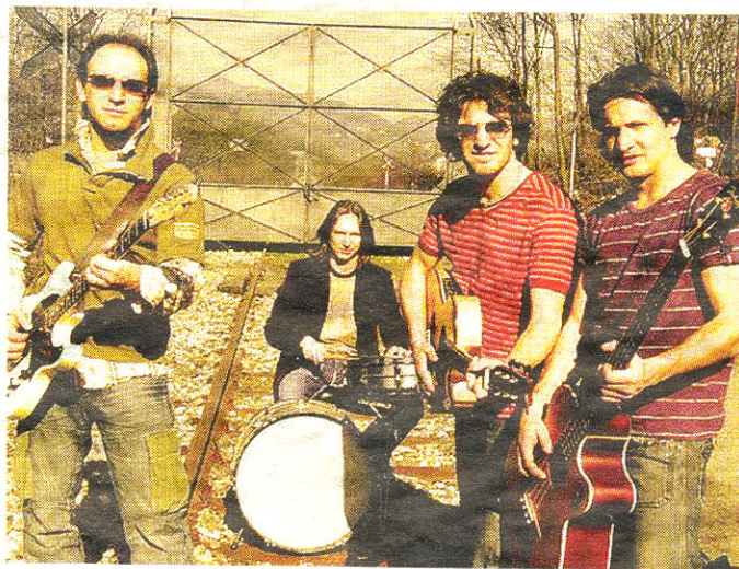
I «7Grani», band lariana che ha avuto un grosso successo in Oregon